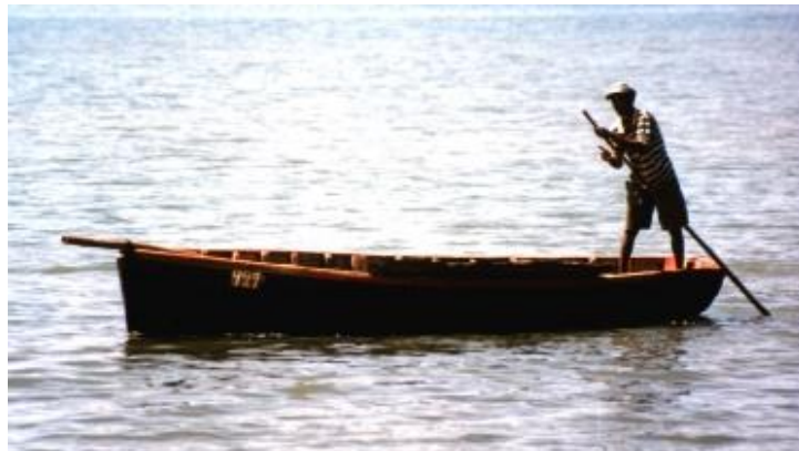
Деревянная лодка в Маврикии

Двое моих друзей подняли лодку со мной внутри над скалой, обдирая дно. Лодка была деревянной и на ней они зарабатывали себе на жизнь, так что я понял, что ситуация очень серьезная, если они так поступают. Они перенесли лодку в лагуну и поплыли, стараясь подтолкнуть лодку, чтобы она пошла дальше. Я сказал: «Пойдемте со мной!» Но они ответили: «Нет, лодка будет слишком тяжелой, пусть мальчик отвезет тебя на берег». Так что этот малыш стал работать шестом подгоняя лодку к берегу.