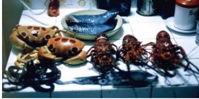
Типичный урожай даров моря

После того, как я наплавался, сколько моей душе угодно, на серфинге в очень быстром левостороннем проеме в скале на Тамарине в течение нескольких недель, мои деньги были на исходе. Так что я направился в Южную Африку, где нашел работу – обучать виндсерфингу и воднолыжному спорту. Удивительно, что они на самом деле платили мне за это! Я плавал на доске по Джеффриса Бэй и Эландс Бэй и посетил некоторые из всемирно известных южноафриканских заповедников.