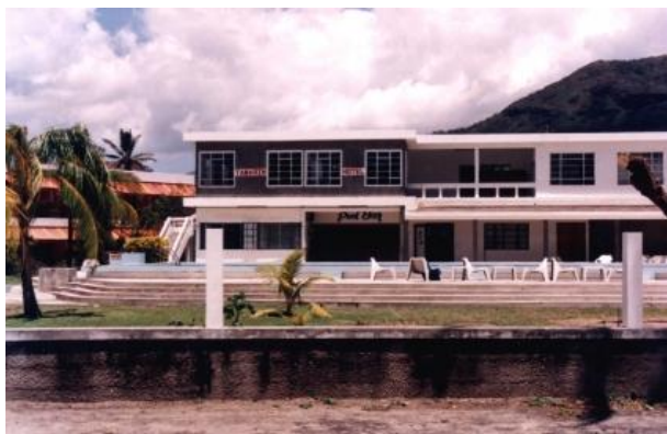
Гостиница в Тамарин Бэй