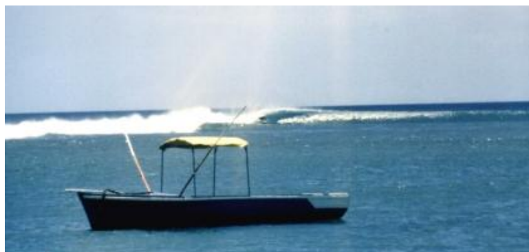
Серфинг в Маврикие

Во время остановки в Реюньон я нашел изумительную расщелину для серфинга, называемую Санкт-Леу, где я поплавал на замечательных волнах. Затем я направился в Маврикий. Это было в марте 1982, к этому моменту я путешествовал почти два года, часто проводя ночь в палатке на берегу и живя, как кочевник. Пришло время возвращаться домой.