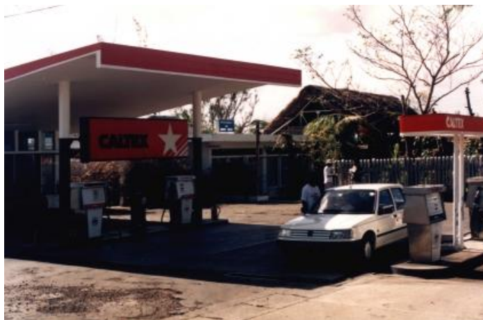
Benzinăria unde Ian a cerșit ajutor pentru a-și salva viața

Apoi am auzit o voce clară spunându-mi din nou: „Ian, ești dispus să cerșești ajutor pentru a-ți salva viața?” Sigur că eram! Și știam chiar și cum s-o fac. Trăisem destul timp în Africa de Sud și îi văzusem pe oamenii de culoare făcându-și mâinile căuș, aplecându-și capul în fața albilor și spunând: „Da, stăpâne”. Îmi era foarte ușor să mă așez în genunchi pentru că piciorul drept era deja paralizat, iar stângul era foarte slăbit. Mă sprijineam de mașină, așa că doar m-am lăsat în jos pe genunchi și mi-am făcut mâinile căuș. Plecându-mi capul, ca să nu-i privesc, am cerșit îndurare pentru viața mea. Aproape plângeam. Știam că dacă nu ajung curând la spital, nu voi mai merge nicăieri. Dacă indivizii aceia nu aveau pentru mine compasiune și dragoste în inima lor și nu-mi arătau îndurare, urma să mor chiar acolo, în fața lor.