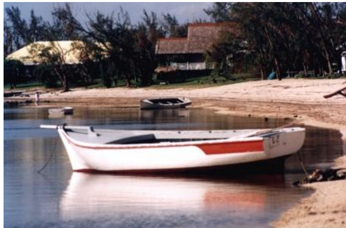
Riviere Noire, locul unde a acostat barca și a fost lăsat lan

Era cam miezul nopții. Locul era pustiu – nici o mașină, nimic. Mă țineam de băiat, întrebându-mă cum păcatele aveam să ajung de acolo la spital atât de târziu în noapte. Piciorul drept era așa de slăbit încât m-am așezat pe asfalt. Băiatul a încercat să mă ajute, dar în cele din urmă a început să arate din nou spre ocean, zicând: „Frații mei! Trebuie să mă duc după ei”. I-am zis să rămână și să mă ajute. Știam că ceilalți puteau înota în siguranță de la recif pentru că meduzele se aflau de cealaltă parte a recifului. Dar a plecat și am rămas singur pe marginea șoselei, în toiu nopții. Nu mai aveam nici o speranță și m-am lungit ca să mă odihnesc.