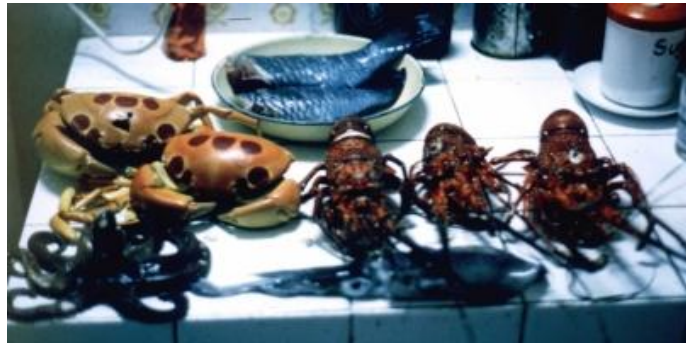
O recoltă tipică de fructe de mare

hotărăști pe care vrei să-l înhați pentru cină. A fost un sport fantastic. Ne vindeam prada la hotelul turistic local.