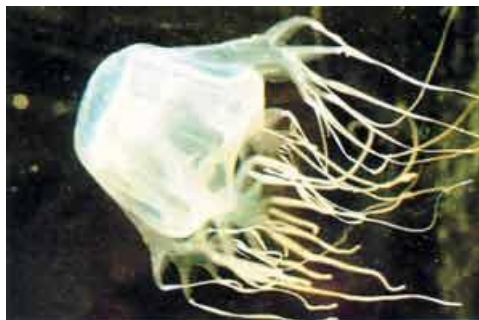
Viespe de mare

Ne-am scufundat. Eu am luat-o în susul recifului, iar cei doi prieteni ai mei au luat-o în jos. De obicei stăteam împreună, dar dintr-un motiv oarecare ne-am despărțit. Căutam languste, când fasciculul lanternei mele a dat de o creatură marină stranie în apa întunecată. Semăna cu un calmar. Curios, am înotat mai aproape de ea și efectiv am întins mâna s-o prind. Aveam mânușile de scafandru și pur și simplu mi s-a strecurat printre degete ca o meduză. O priveam în timp ce se îndepărta, intrigat, deoarece era o meduză cu aspect foarte ciudat. Avea ceea ce părea a fi capul în formă de clopot al unui calmar, dar spatele avea formă de cutie și tentaculele erau foarte neobișnuite, transparente, ca niște degete, care se întindeau mult în urma ei. Până atunci nu mai văzusem acel soi de meduză, dar m-am întors și am continuat să caut languste.